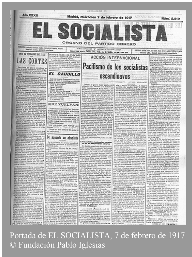
Portada de EL SOCIALISTA, 7 de febrero de 1917 © Fundación Pablo Iglesias

En el Senado se formulan ruegos y preguntas de escasa importancia, que son contestadas por los hombres de Gobierno con las acostumbradas vaguedades. Y en esta alta Cámara se discute un proyecto de ley sobre el duelo, que con contundentes razonamientos combate el arzobispo de Tarragona... © Fundación Pablo Iglesias