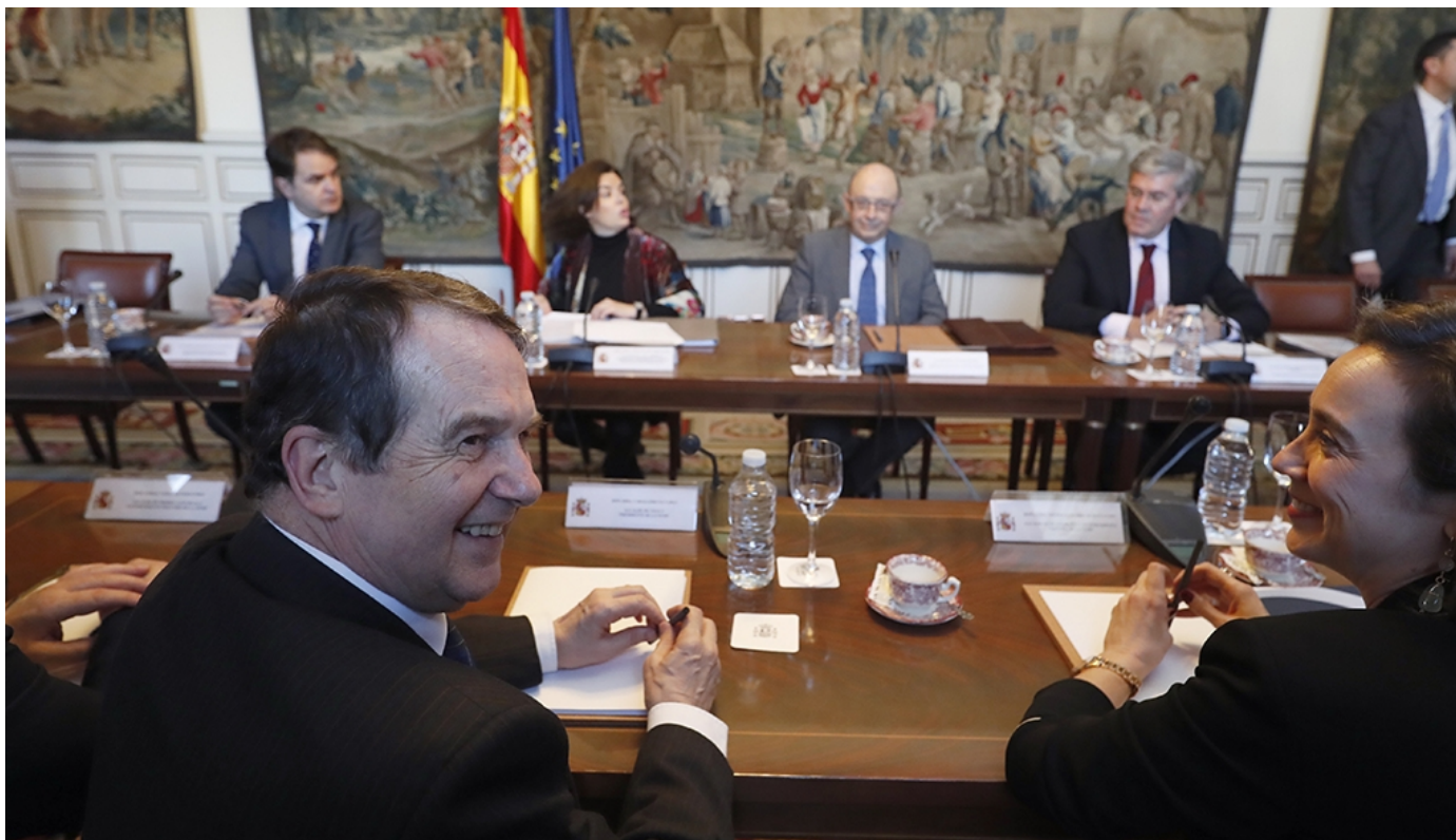
Abel Caballero (en primer plano) con representantes de la Federación Española de Municipios y Provincias

El presidente de la FEMP, Abel Caballero, dijo ayer que había acordado con el Gobierno la constitución de un grupo de diez expertos (cinco nombrados por la Administración central y cinco por ayuntamientos y diputaciones) para abordar la financiación local, de forma paralela a la autonómica.